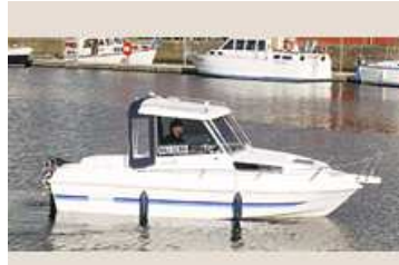
Mit der „Möwe“ als Freizeitkapitän Lübeck vom Wasser aus entdecken.