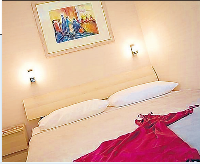
Wie Gott in Frankreich: Es gibt zwei Schlafräume. Mit ganz normalen Betten. Dazu Nachttisch und Fernseh-Anschluss. Das Krabbeln in die Kajüte entfällt. Man kann quasi stehend ins Bett fallen.