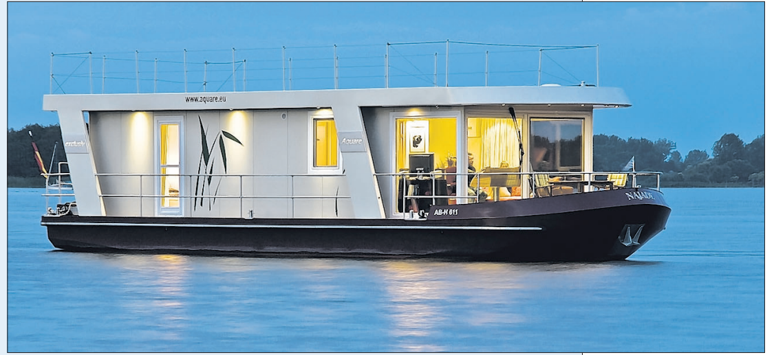
Die „Aquare 500“ – der Luxus hält im Hausboot Einzug. Alles ist möglich. Gegen Aufpreis wird auch eine Sauna eingebaut. Auch das Dach gehört zum Lebensbereich dazu. Eine riesige Freifläche wird von einer Reling gesichert.

Blick in den Salon: Weder von außen noch von innen erschweren Treppen den Zugang. Es gibt alles, was das Leben auf dem Wasser angenehm macht. Familien und Rentner sind die Zielgruppe. Wer will, kann die „Aquare“ für Ausflüge buchen – oder sie gleich ganz kaufen.